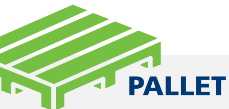
Full Pallet 1.200 Kg