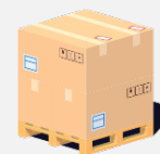
Half Pallet 500 Kg

Altezza: 120cm Larghezza: 100cm Profondità: 120cm