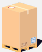
Light Pallet 750 Kg

Altezza: 220cm Larghezza: 100cm Profondità: 120cm