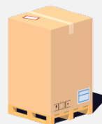
Euro Light Pallet 750 Kg

Altezza: 220cm Larghezza: 80cm Profondità: 120cm